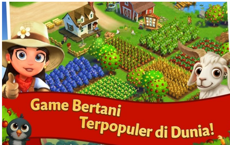
Gambar 2. Popularitas Game FarmVille-2