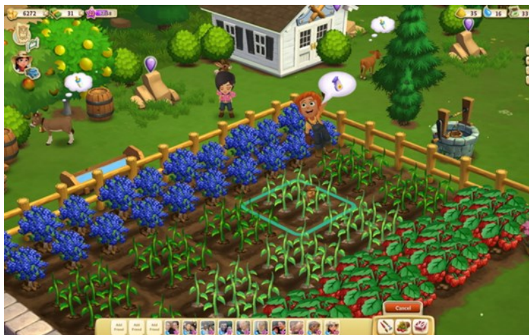
Gambar 3. Tampilan Game FarmVille-2

Zynga pada tanggal 19 Juni 2009. Kehadirannya FarmVille-2 sampai saat ini mampu menarik jutaan pemain. Genre game FarmVille-2 termasuk simulation RPG dengan mode single-player dengan interaksi multiplayer . Media yang digunakan dalam memainkan game FarmVille-2 yaitu browser web dengan media interface input atau alat pengontrol berupa keyboard , mouse atau sejenisnya. Interaksi dalam game dapat terjadi melalui berbagai aktivitas. Dalam game berbasis media jejaring sosial Facebook, terdapat satu bentuk interaksi yang menarik dimana interaksi tersebut di susun sedemikian rupa melalui sistem terprogram. Sekalipun pengguna game atau user sudah tidak berada pada aplikasi game, pemain masih bisa berhubungan melalui item atau objek yang dikirim melalui layar Facebook. Items dapat digunakan dalam aplikasi game FarmVille-2 sebagai gift untuk pemain lain atau sebaliknya. Gift berupa items yang dapat dipergunakan apabila pemain kembali masuk kedalam aplikasi game FarmVille-2 melalui situs Facebook. Informasi mengenai pencapaian yang dilalui pemain lain juga diinformasikan melalui media situs Facebook, sehingga interaksi antara pemain game FarmVille-2