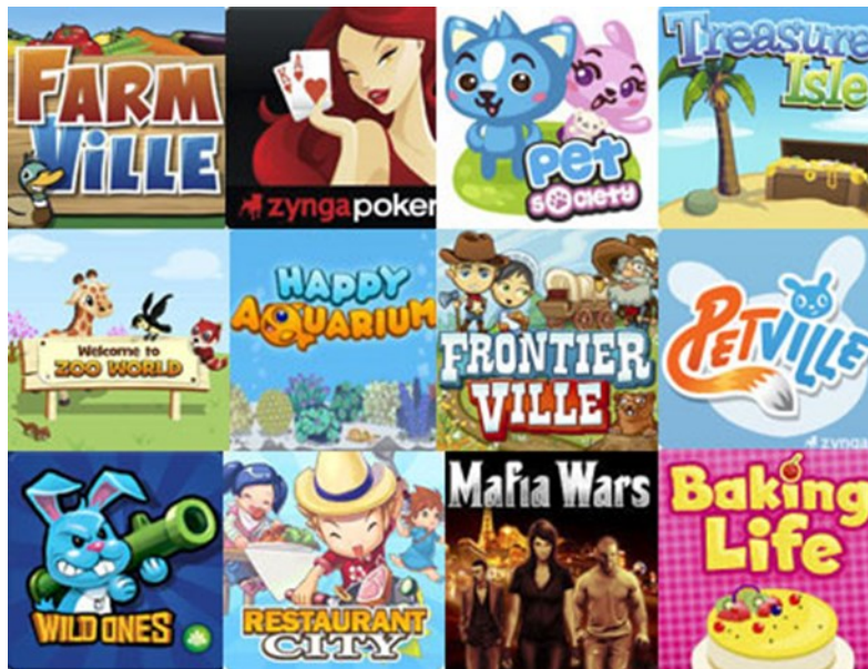
Gambar 1. Game dalam situs Facebook