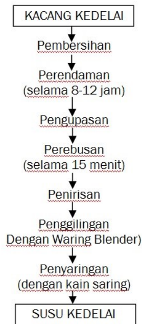
Gambar 1. Diagram Alir Cara Pembuatan Susu Kedelai (Andhika, 1982)

Untuk menghilangkan bau langu dari susu kedelai telah dilakukan penelitian-penelitian. Aman (1972), telah melakukan penelitian pembuatan susu kedelai yang memenuhi syarat sebagai minuman manusia. Ternyata kedelai yang direndam dalam larutan \text{Na}_2\text{CO}_3 sebanyak 0,003 % selama 12 dengan cara ekstraksi panas pada campuranyang terdiri dari satu bagian berat (gram) kedelai dan sepuluh bagian isi (milliliter) air sebagai bahan pengestrak, menghasilkan susu kedelai yang bermutu