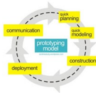
Gambar 2. Model Pengembangan Prototyping

model pengembangan prototyping ini digambarkan pada gambar 2. Model Pengembangan Prototyping .